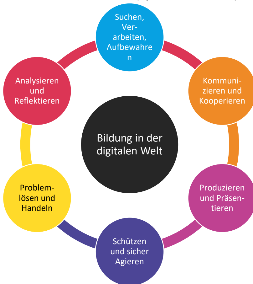
Abbildung 2 Sechs Dimensionen der „Bildung in der digitalen Welt“

Die RehabilitandInnen, die am Projekt IDiT teilnehmen, haben im September 2019 ihren Reha-Vorbereitungskurs begonnen und absolvieren zwischen Oktober 2019 und März 2020 das Medienkompetenzmodul. Dort werden die sechs Kompetenz-Dimensionen des Strategiepapiers der Kultusministerkonferenz (Vgl. KMK 2016, S. 16ff.) aufgegriffen: